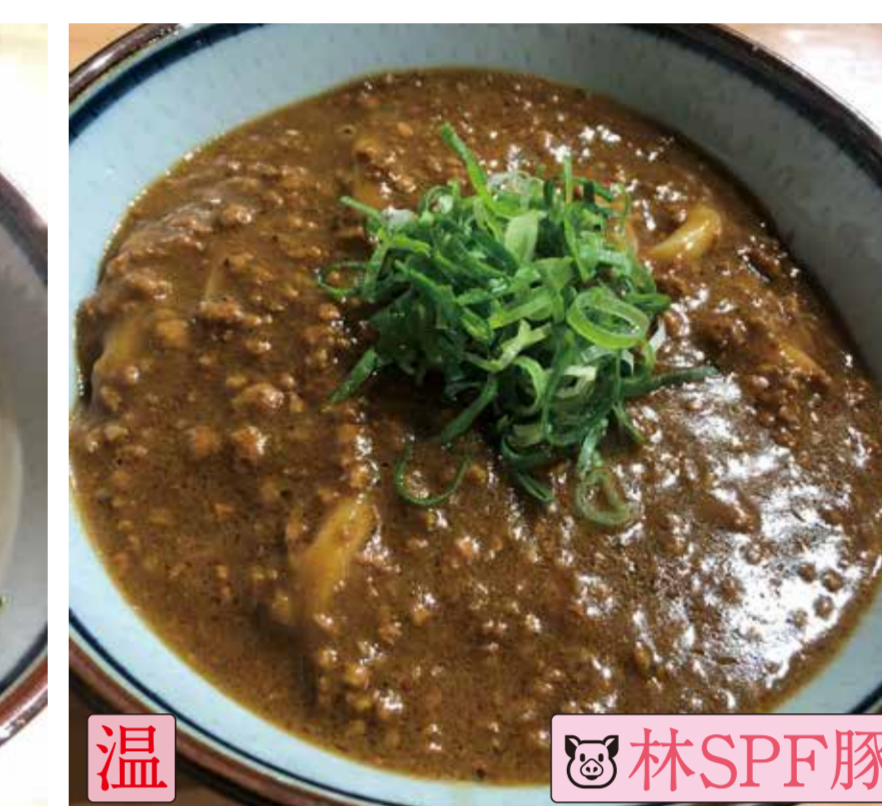
カレーうどんK-M (キーマカレー)