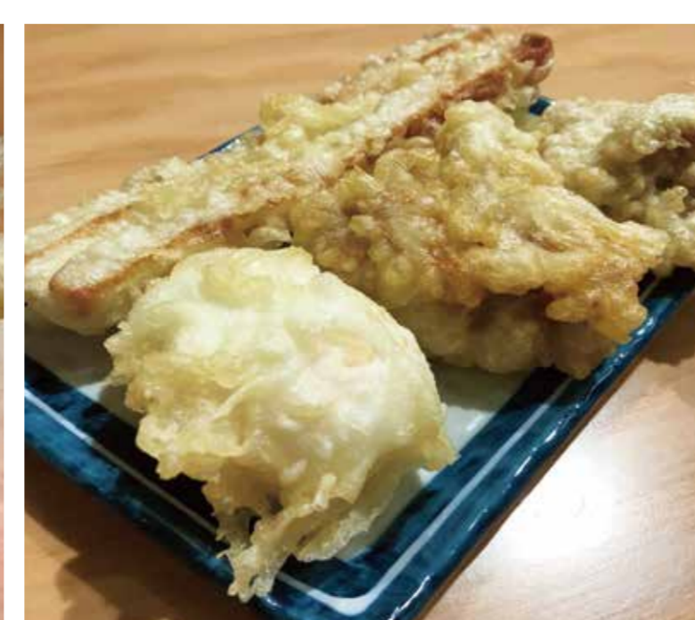
天ぷら3種盛り (鶏天2ヶ、半熟卵天1ヶ、ちくわ天1ヶ)