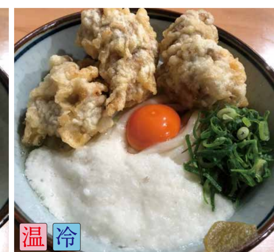
鶏天月見山しょうゆ (鶏天3ヶ)