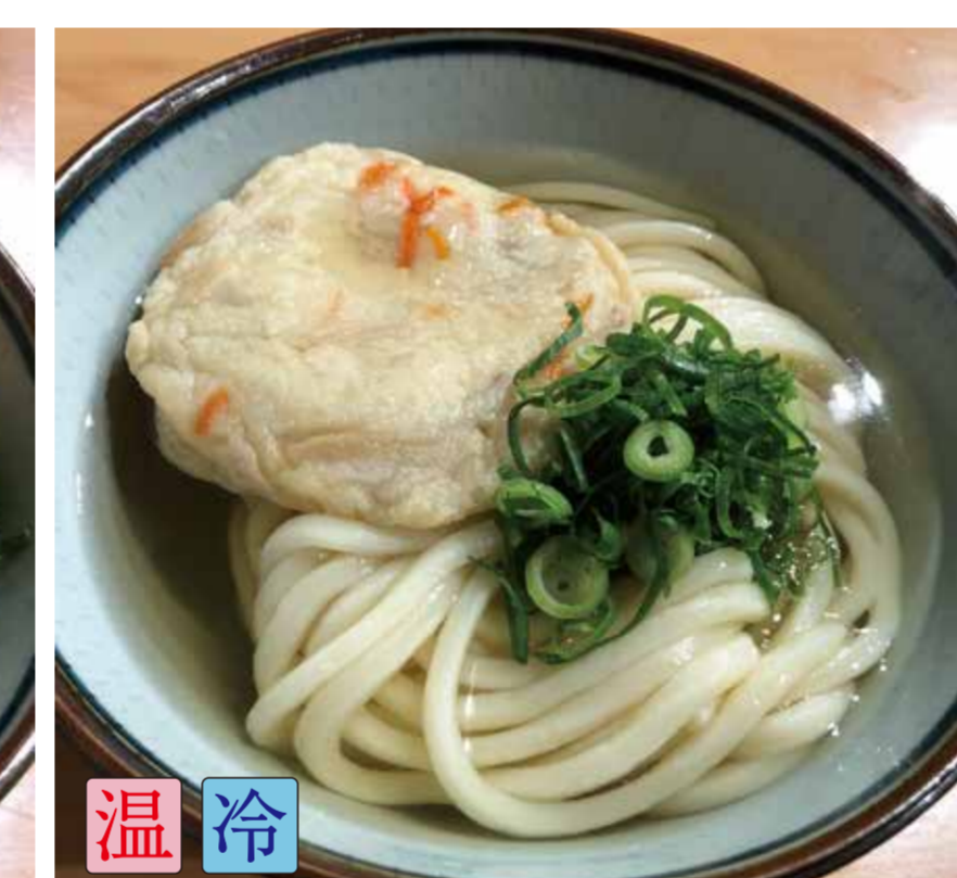
丸天うどん (香川直送の丸天) ※内容は日替わり