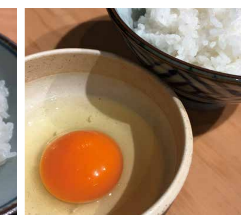
たまごかけ ごはん