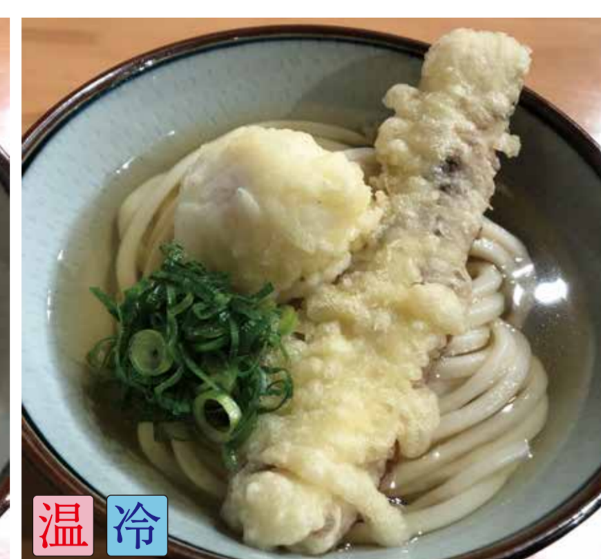
ちく玉天うどん (半熟卵天1ヶ、ちくわ天1ヶ)