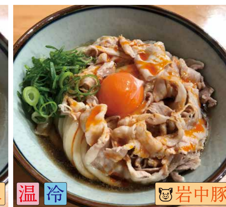
肉たまぶっかけRED (ピリ辛・ラー油)