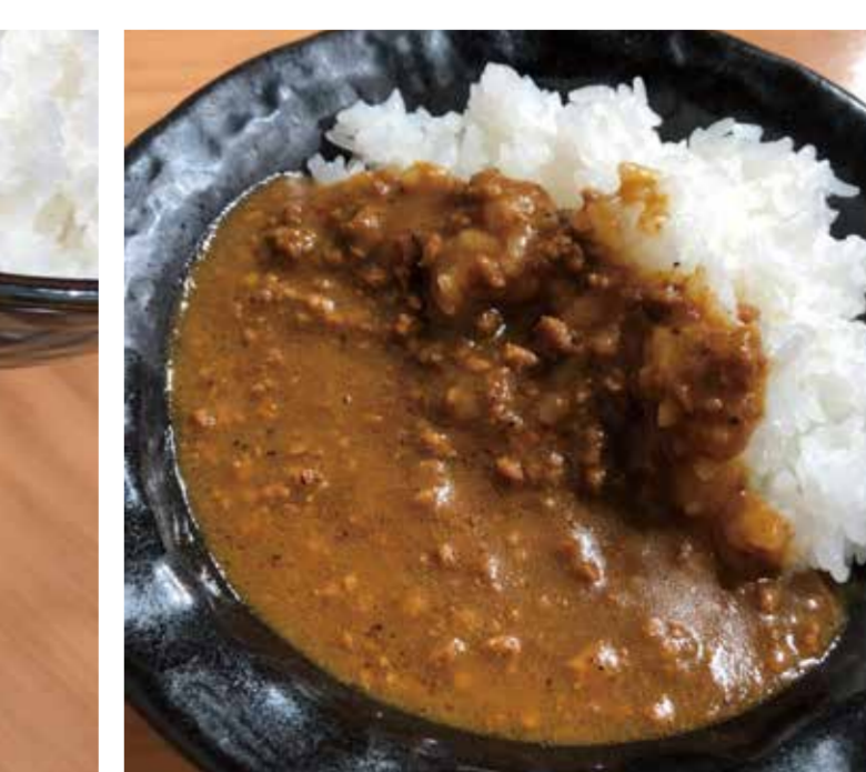
ミニカレー (キーマカレー)