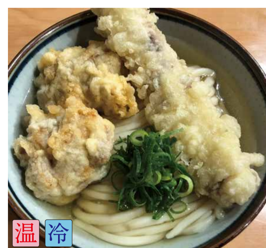
天ぷらうどん (鶏天2ヶ、ちくわ天1ヶ)