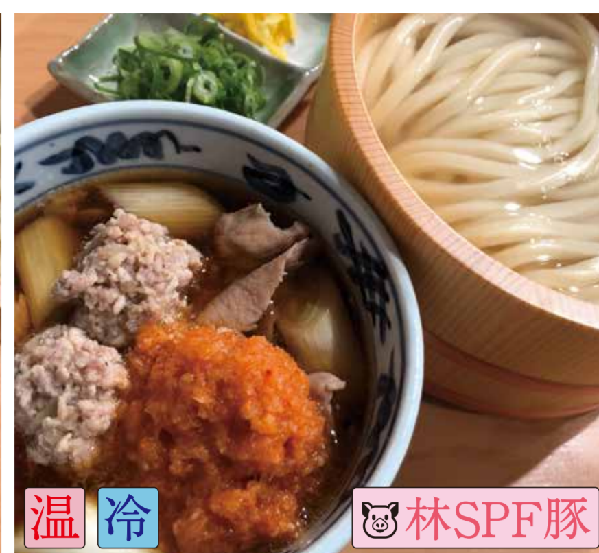
辛おろし肉汁うどん (もみじおろし)