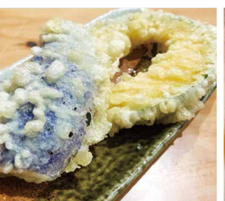
日替わり野菜天 (内容は日替わり)