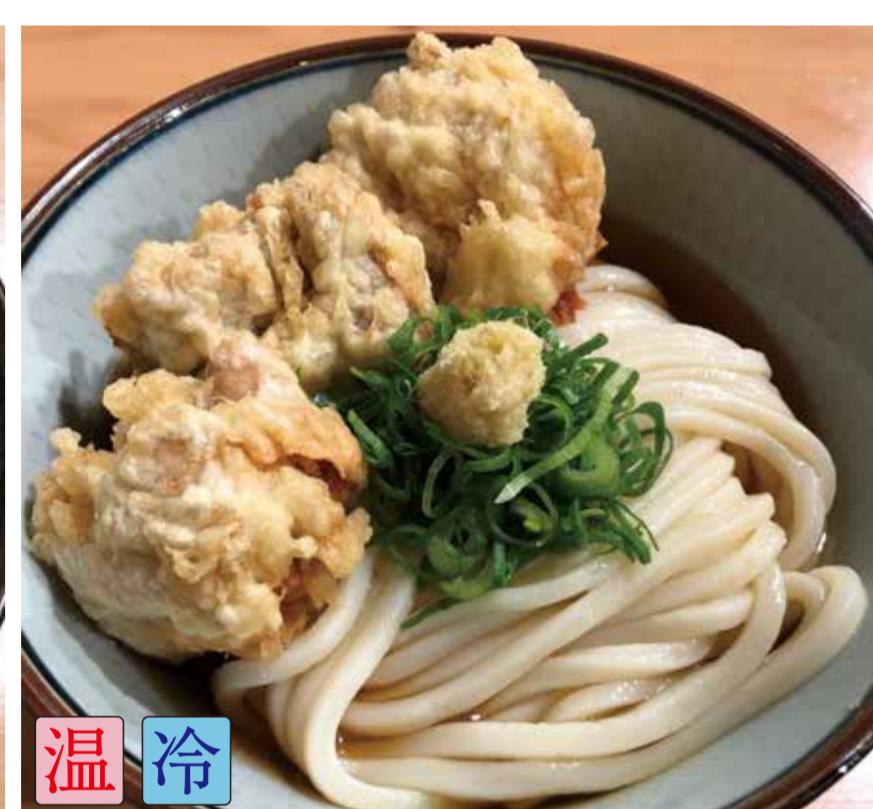
鶏天ぶっかけ (鶏天3ヶ)