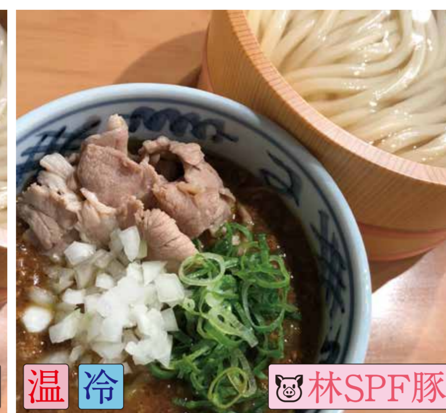
肉汁カレーうどん