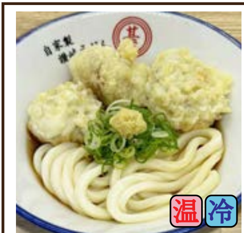
鶏天ぶっかけ (鶏天3ヶ) 650円