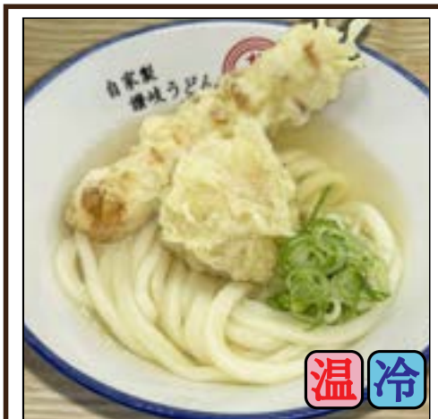
ちく玉天うどん (ちくわ天1本・たまご天1ヶ) 650円