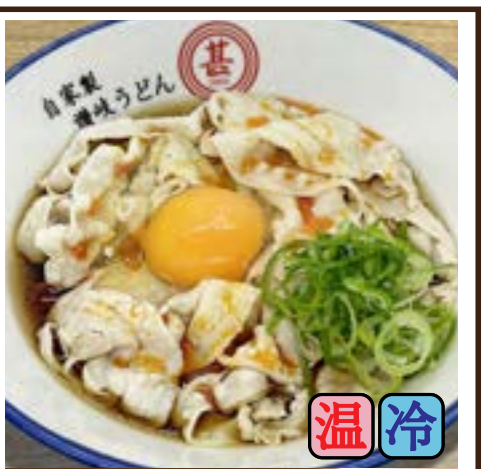
肉たまぶっかけRED (豚バラ・ピリ辛ラー油) 780円