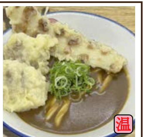
天カレー (鶏天2ヶ・ちくわ天1本) 800円