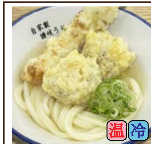
天ぷらうどん (鶏天2ヶ・ちくわ天1本) 650円