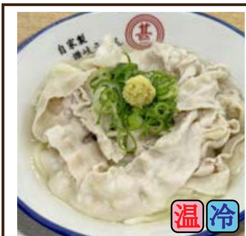
肉かけ (豚バラ) 740円