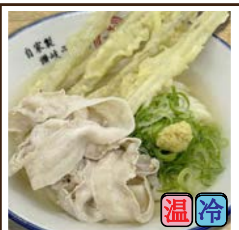
肉ごぼ天うどん (豚バラ・ごぼり天5本) 780円