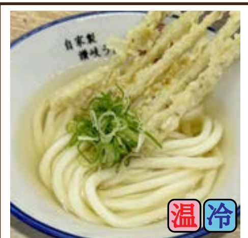
ごぼり天うどん (ごぼり天5本) 630円