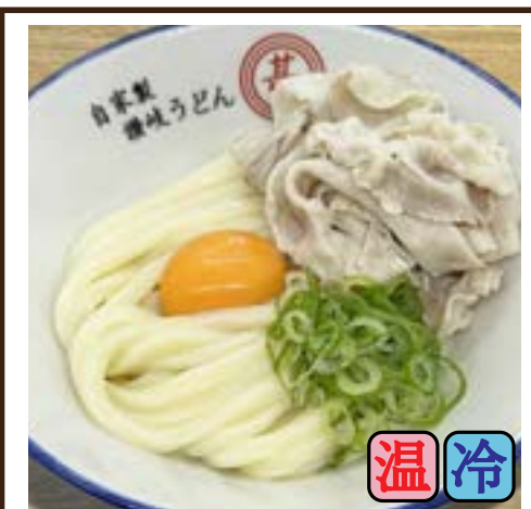
肉たましょうゆ (豚バラ) 780円