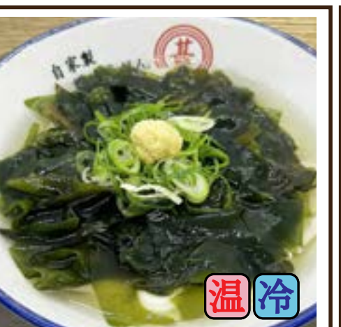
鳴門天然わかめ (25%増量) 680円