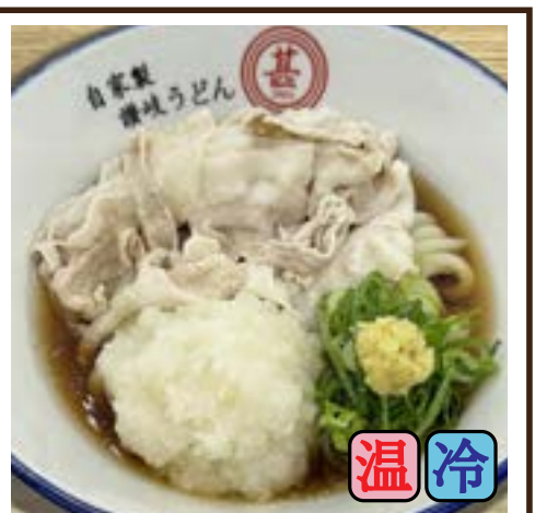
肉おろしぶっかけ (豚バラ) 780円