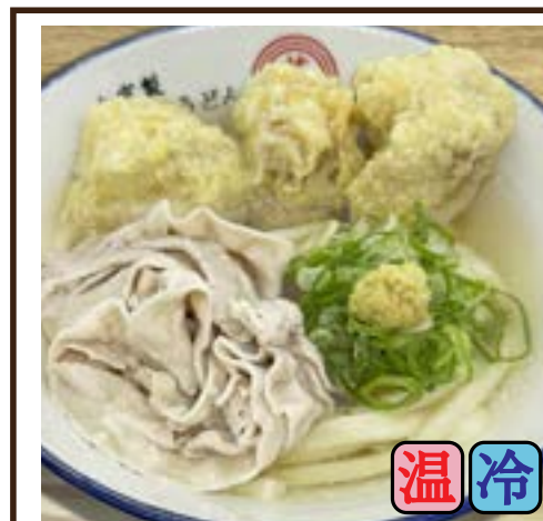
スペシャル (豚バラ・鶏天3ヶ) 780円