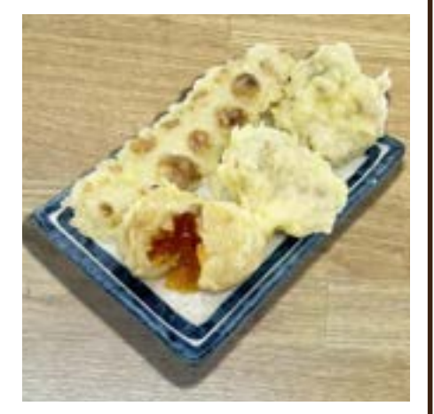
天ぷら3種盛り (鶏天2ヶ・ちくわ天1本・たまご天1ヶ) 360円