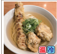
天ぷらうどん (鶏天2ケ・ちくわ天1本)