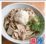
肉おろしぶっかけ (豚バラ)