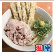
肉ごぼ天うどん (豚バラ・ごぼう天5本)