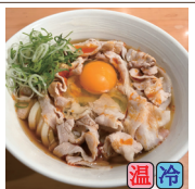
肉たまぶっかけRED (豚バラ・ピリ辛ラー油)