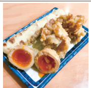
天ぷら3種盛り (鶏天2ケ・ちくわ天1本・たまご天1ケ)