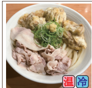
スペシャル (豚バラ・鶏天3ケ)