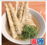
ごぼ天うどん (ごぼう天 5本)