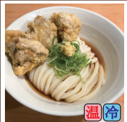
鶏天ぶっかけ (鶏天3ケ)