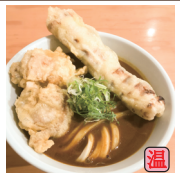
天カレー (鶏天2ケ・ちくわ天1本)