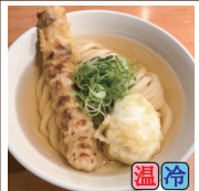
ちく玉天うどん (ちくわ天・たまご天)