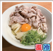
肉たましょうゆ (豚バラ)