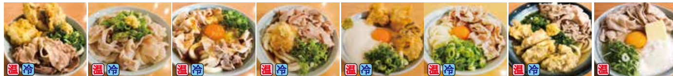
スペシャル(豚肉・鶏玉) 720円 肉かけ(豚肉) 680円 肉たまぶっかけRED 720円 肉おろしぶっかけ 720円 鶏天月見山しょうゆ 740円 肉たましょうゆ 700円 超スペシャル肉うどん(豚肉2倍・鶏天4ヶ) 920円 肉月見山バターしょうゆ 880円