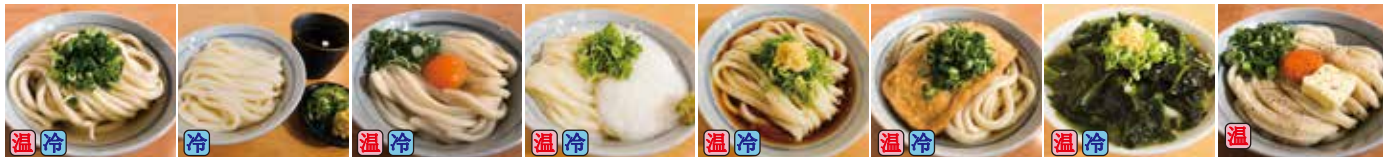
かけ 390円 ざる(つけ) 430円 月見しょうゆ 470円 山芋しょうゆ 530円 ぶっかけ 430円 きつねうどん 500円 わかめうどん 600円 たまごバターしょうゆ 580円