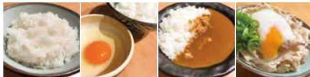
ごはん 100円 たまごかけごはん 150円 ミニカレー 200円 ぶたまし 250円