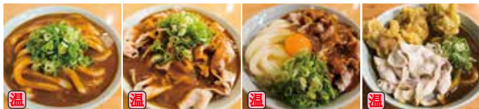
カレーうどん 600円 特肉カレー 820円 肉たまカレー 780円 カレースペシャル 900円