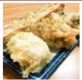
天ぷら3種盛り (鶏天2ヶ・ちくわ天1本・半熟卵天1ヶ)