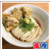
鶏天ぶっかけ (鶏天3ヶ)