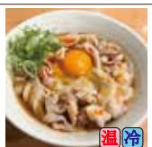
肉たまぶっかけ RED (豚バラ・ピリ辛ラー油)