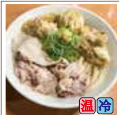
スペシャル (豚バラ・鶏天3ヶ)