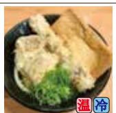
天きつね (鶏天2ヶ・ちくわ天1本)