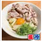
肉玉しょうゆ (豚バラ)