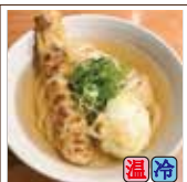
ちく玉天うどん (ちくわ天1本・半熟卵天1ヶ)