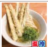
ごぼ天うどん (ごぼう天5本)