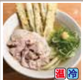
肉ごぼ天うどん (豚バラ・ごぼう天5本)