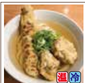
天ぷらうどん (鶏天2ヶ・ちくわ天1本)