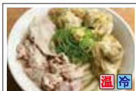
スペシャル (豚バラ・鶏天3ヶ)