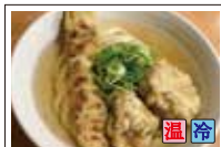
天ぷらうどん (鶏天2ヶ・ちくわ天1ヶ)