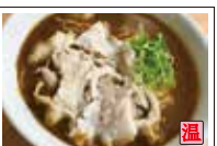
カレーうどん (肉入り)