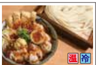
辛味肉汁 (味玉付き)