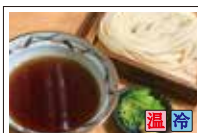
つけ汁うどん (ざる)