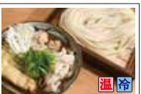
肉汁カレーつけ麺