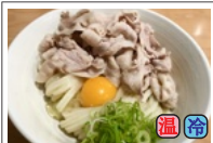
肉たましょうゆ 720円