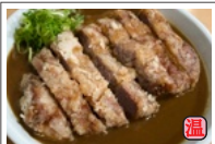
豚唐揚げカレー (豚の唐揚げ 120g) 920円