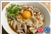
肉たまぶっかけRED 740円