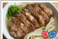
豚唐揚げうどん (豚の唐揚げ 120g) 790円