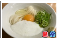
月見山しょうゆ 620円