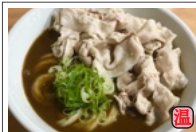
特肉カレー (肉増量 1.5倍) 840円