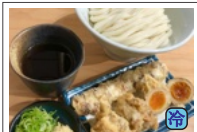
つけ天3種盛り (鶏天 1ヶ、たまご天、ちくわ天) 740円