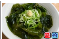
天然鳴門わかめ 640円